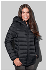
ST5520 Lux Padded Jacket