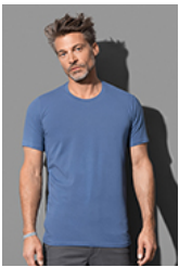
ST9600 Clive Crew Neck