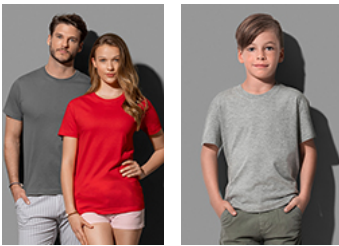
ST2020 Classic-T Organic